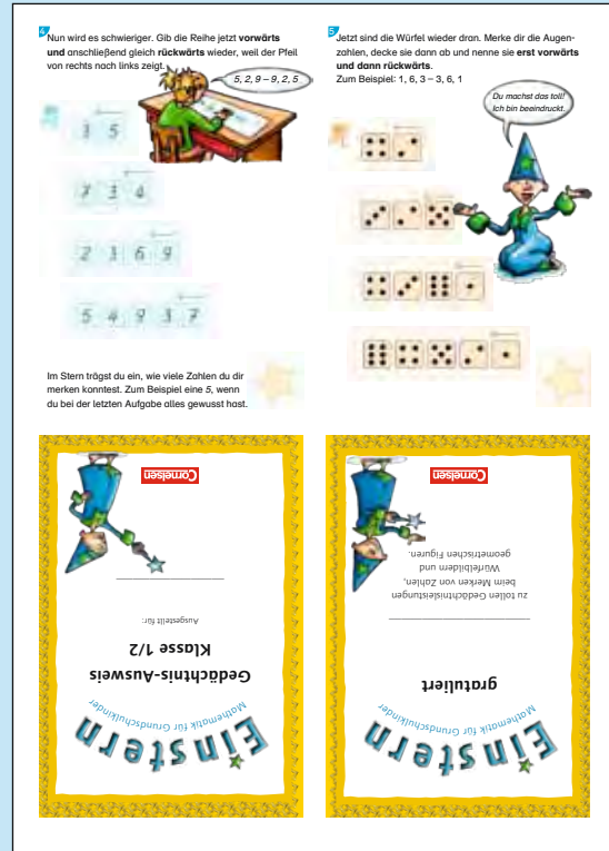
Ausdruck Seite 1: Innenseite

1. Drucken Sie die beiden Kopiervorlagen auf die Vorder- und Rückseite eines DIN-A4-Blattes